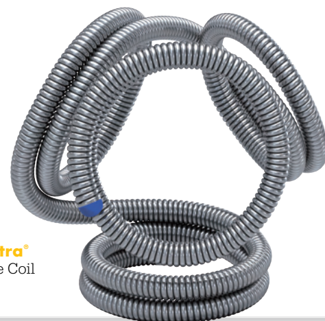
Target Tetra® Detachable Coil