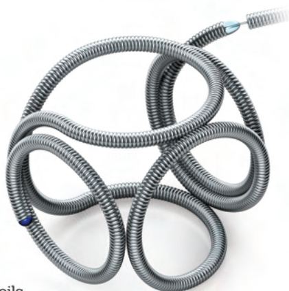
Target® Detachable Coils