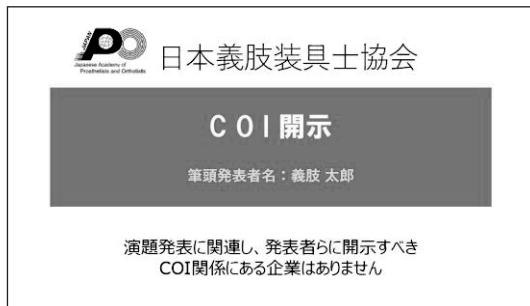
開示すべき COI がない場合

「座長・演者の方へのご案内 参加者へのご案内」ページに参考フォーマットをご用意しておりますので、ご利用ください。